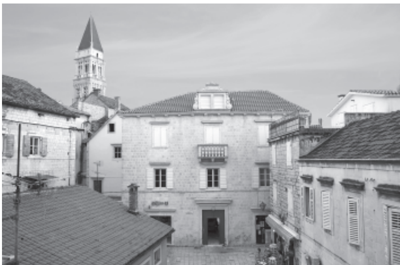
Muzej Grada Trogira

pukih obavijesti, jer autor se služio svom tada dostupnom literaturom, kao i arhivskom građom.